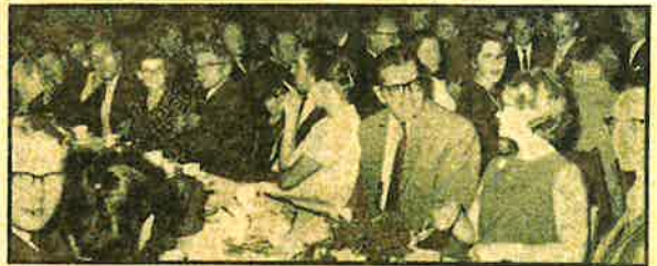
Der var spænding over forsamlingen, da lodtrækningen fandt sted.

Vedrørende campingmuligheder i Mosambique er de sådan, at man kan campere, hvor man vil. Der er indrettet mange campingpladser, og myndighederne står til turisternes rådighed. Man vil gøre alt for at skaffe turistene en vidunderlig ferie. Man